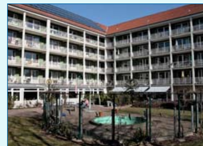
Zimmer mit Balkonen

Impressum: Herausgeber: Direktor Dr. Burkhard Budde Helmstedter Str. 35, 38102 Braunschweig Tel.: 05 31 / 70 11 – 0 Fax.: 05 31 / 70 11 – 307 E-Mail: marienstift@marienstift-braunschweig.de