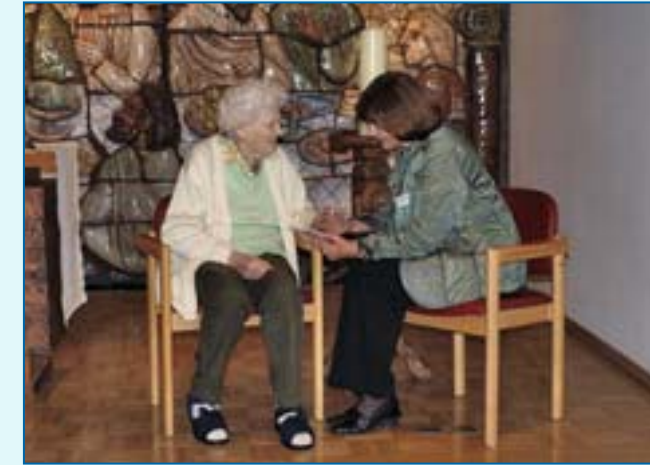
Seelsorgerin im Gespräch