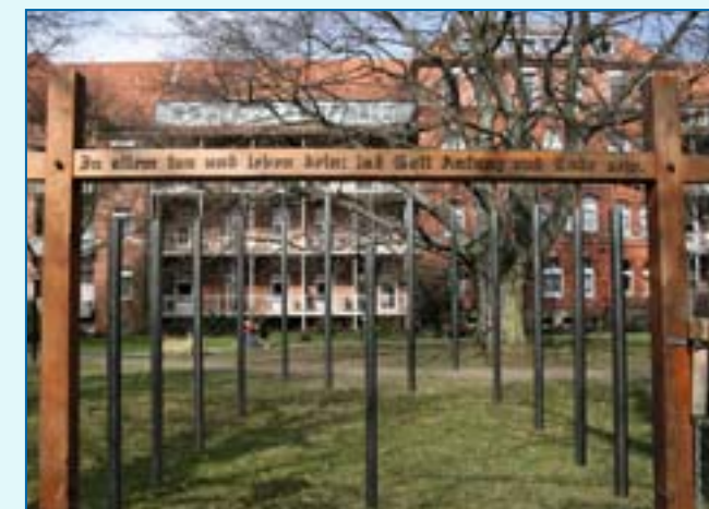
Klangspiele im Garten