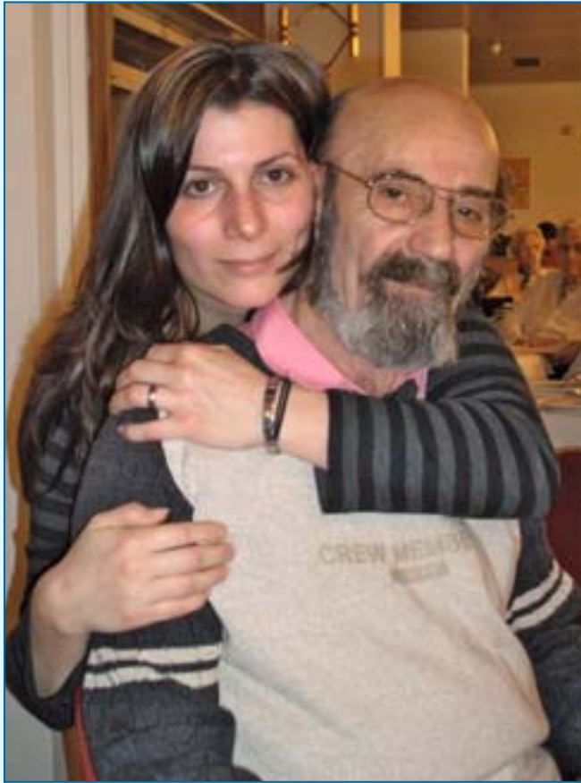
Vater und Tochter