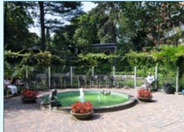
Brunnen im Park