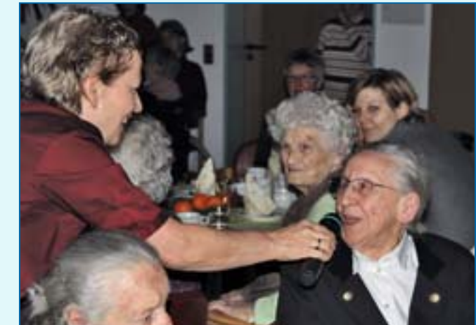
Feier im Wilhelm-Löhe-Saal