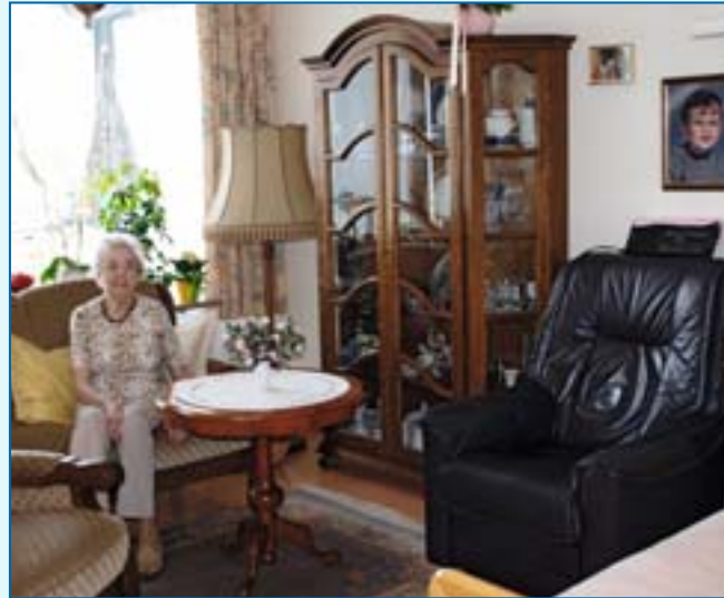
Bewohnerin in ihrem Zimmer