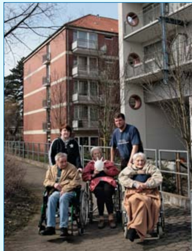
Schüler mit Bewohnern