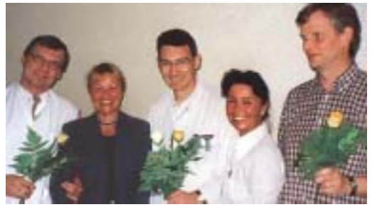
Mitglieder des neuen Anästhe- sie-Teams