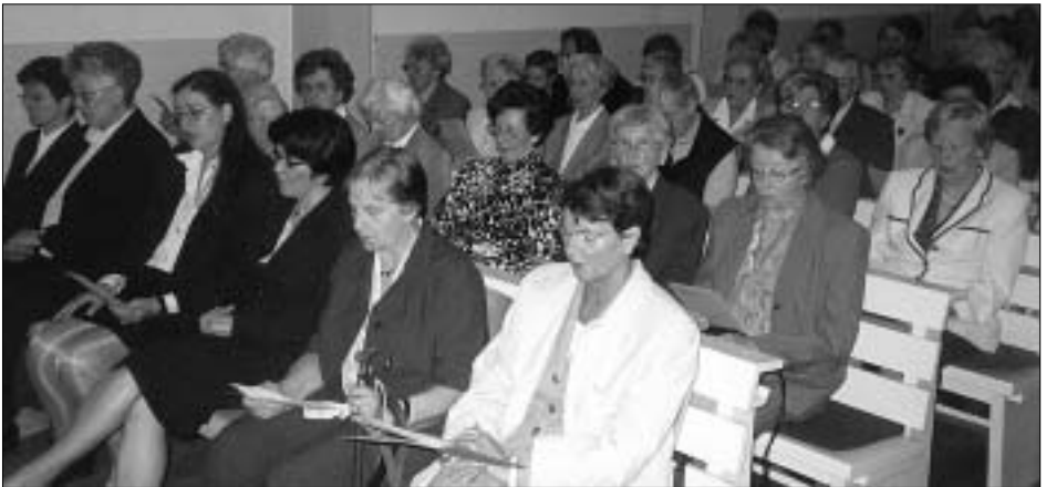
„Grüne Damen“, Mitglieder der Diakonischen Gemeinschaft und Freunde des Marienstiftes.