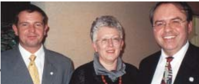
Der neue Vorstand des Marienstiftes.