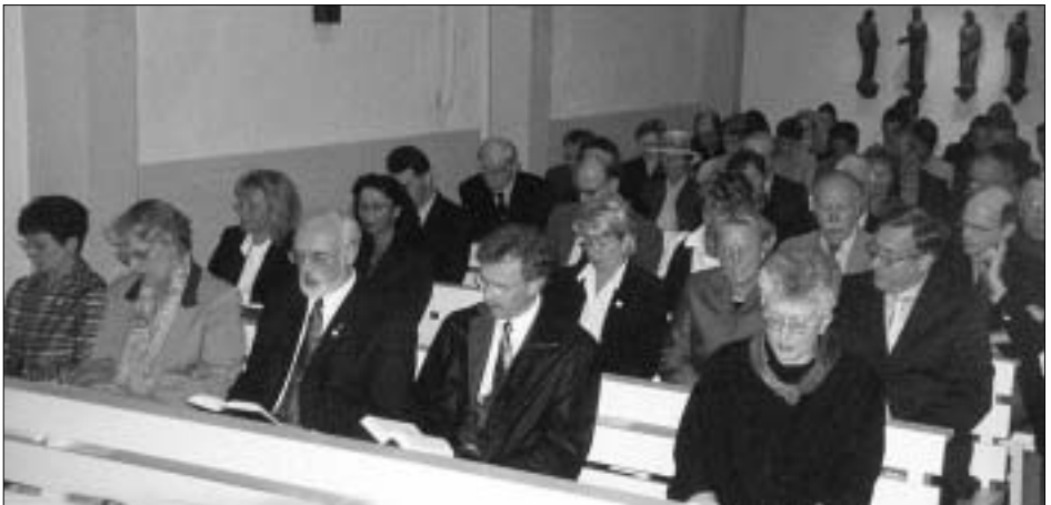
Die Veranstaltung in der Kirche wurde über die hausinterne Video-Anlage in die Räume des Krankenhauses, des Altenpflegeheimes und des Mutterhauses übertragen.